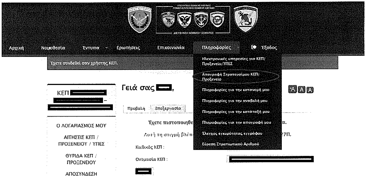
Εικόνα 2: Αρχική οθόνη